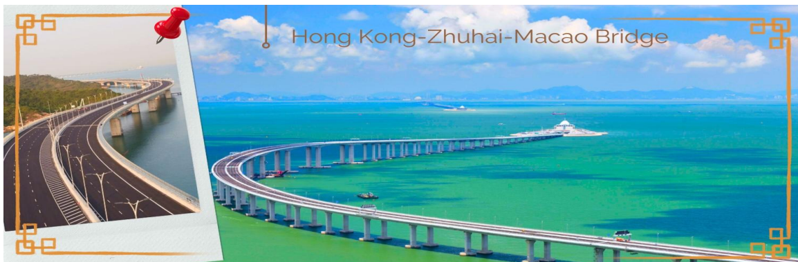
CHXH10 ฮองกง-มาเก๊า-จูไห่ 4 วัน 2 คืน บิน Hong Kong Airlines (HX) May-Oct'26

02.40 น. นำท่านเดินทางสู่ ฮองกง โดยสายการบิน HONG KONG AIRLINES (HX) เที่ยวบินที่ HX768 07.00 น. เดินทางถึงสนามบินเซ็กแล็บก๊อ เขตปกครองพิเศษฮองกง นำทุกท่านเข้าพิธีการตรวจคนเข้าเมืองหลังจากผ่านพิธีการตรวจคนเข้าเมืองเป็นที่เรียบร้อยแล้ว รับกระเป๋าสัมภาระ และเดินทางโดยรถโค้ชปรับอากาศ เวลาท่องเที่ยวที่ฮองกงเร็วกว่าประเทศไทย 1 ชั่วโมง กรุณาปรับนาฬิกาให้ตรงกับเวลาท้องถิ่น เพื่อสะดวกในการนัดเวลา จากนั้นนำท่านเดินทางสู่ มาเก๊า (MACAU) หรือ เฮ้าเหมิน (รถโค้ชปรับอากาศ) ด้วยการเดินทางผ่านเส้นทางสะพาน Hong kong – Zhuhai – Macao Bridge สะพานมีความยาว 55 กิโลเมตร ซึ่งเป็นสะพานข้ามทะเลที่ยาวที่สุดในโลก สะพานดังกล่าวเปิดใช้งาน เมื่อวันที่ 23 ต.ค. 2561 ซึ่งเชื่อมระหว่างเขตบริหารพิเศษฮองกง กับเมืองจูไห่ของมณฑลกวางตุ้ง และเขตบริหารพิเศษมาเก๊าของจีน โดยสะพานเส้นทางนี้นับเป็นครั้งแรก ที่จะช่วยลดระยะเวลาการเดินทางจากฮองกงไปยังจูไห่และมาเก๊า จากเดิม 3 ชั่วโมง ให้เหลือเพียงภายใน 1 ชั่วโมง มาเก๊า มีชื่อทางการว่า เขตบริหารพิเศษมาเก๊าแห่งสาธารณรัฐประชาชนจีน เป็นพื้นที่บนชายฝั่งทางใต้ของประเทศจีน เป็นเขตปกครองพิเศษของจีน โดยมีฐานะเป็น เขตบริหารพิเศษภายใต้หลักการ หนึ่งประเทศสองระบบ ผู้ที่อาศัยอยู่ในมาเก๊าส่วนใหญ่พูดภาษากวางตุ้งเป็นภาษาแม่ ภาษาจีนกลาง ภาษาโปรตุเกส และภาษาอังกฤษ ชาวมาเก๊า มีความหมายโดยกว้างๆ คือผู้ที่พำนักอาศัยถาวรอยู่ในมาเก๊า ส่วนในวงแคบ หมายถึง คนพื้นเมืองในมาเก๊าที่สืบทอดมาจากชาวโปรตุเกส มักจะผสมกับชาวจีนและบรรพบุรุษชาติอื่นๆ