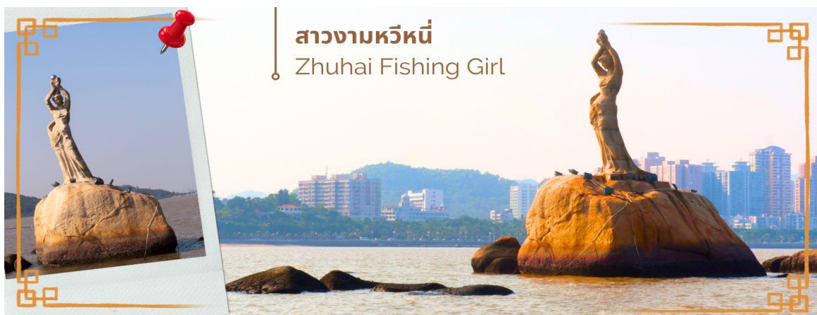
สาวงามหวิหนี่ Zhuhai Fishing Girl

จากนั้นนำท่านแวะซื้อ ยาแก่น้ำร้อนลวก ร้านยา เป่าฟูลิง บัวหิมะ ยาประจำบ้านที่มีชื่อเสียง ท่านจะได้ชมการสาธิตการนวดเท้า ซึ่งเป็นอีกวิธีหนึ่งในการผ่อนคลายความเครียด และบำรุงการไหลเวียนของโลหิตด้วยวิถีธรรมชาติ และนำท่าน